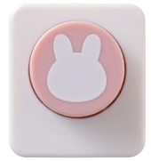
▲海苔パンチ (うさぎ)